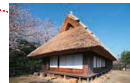
舊味元家住宅主屋 山村移築民家 （登記為有形文化財產・ 2000年4月28日登記）

高知縣立歷史民俗資料館作為高知縣歷史系綜合博物館，自1991年5月開館以來，深受大家的喜愛，被親切地稱為“歷史館”。館內收藏著縣內歷史・考古・民俗的各領域資料，並對其進行調查研究，研究成果通過常設展覽・企劃展覽為首的演講會・展覽室解說・兒童歷史教育室、及“展覽圖冊”、“研究學刊”等公佈於眾。另外，博物館所在地岡豐山是戰國時代長宗我部氏的故居（國史跡・岡豐城跡）的所在地，是一座既可以悠閒地散步又可以瞭解歷史的公園。 2010年4月，根據最新的研究成果，為使常設展更具靈活性和親民性，資料館進行了裝修，並更新了大量展覽資料。另外，為體現本館地處長宗我部氏故居附近的特點，還設立了展有長宗我部氏和岡豐城跡相關資料的長宗我部展覽室。 本館是一個既可以瞭解鄉土的過去，又可以與人相識的場所，希望可以成為大家構築更加美好明天的立足點。