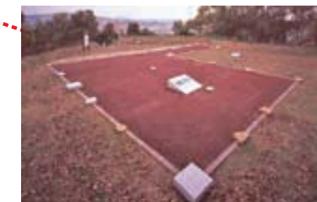
岡豐城跡 詰 復原