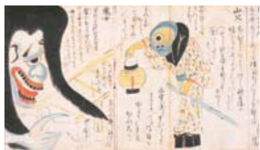
土佐鬼怪畫冊 (複製品) 堀見忠司氏收藏著原資料