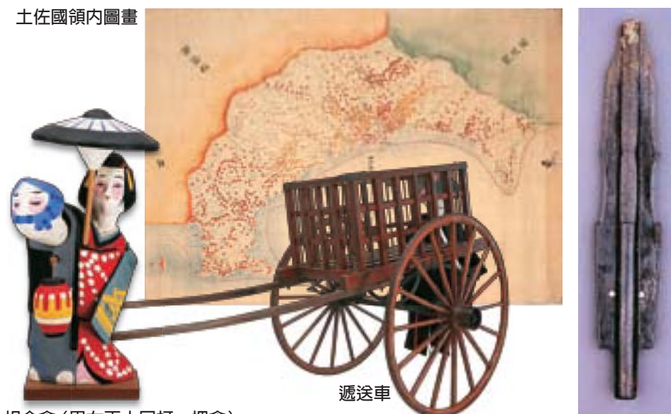
相合傘 (男女兩人同打一把傘)